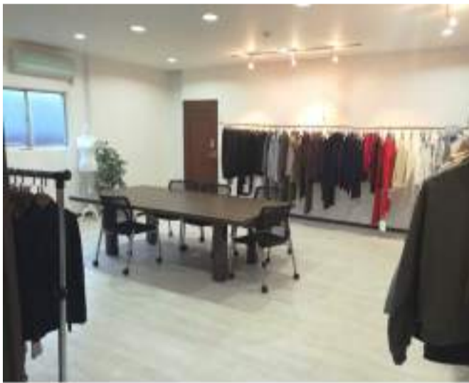
東京墨田区の本社ショールームでは常時300点以上の商品を展示。定期的に最新商品をご案内します。

商品の企画・デザインから生産までを一貫して受託させて頂き、制作に関わる時間・予算などのコストパフォーマンスを図りつつ円滑に進め、ビジネスチャンスを逃しません。