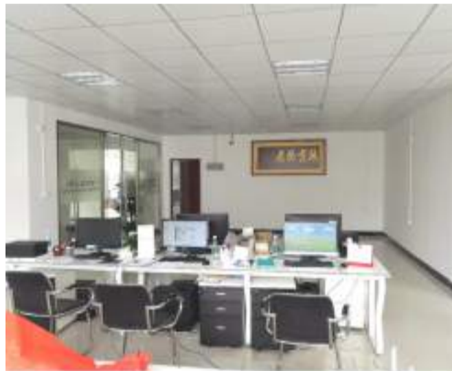
中国の検品所では商品の生産から出荷までを管理。万一のトラブルでも現地の迅速対応で安心サポート。