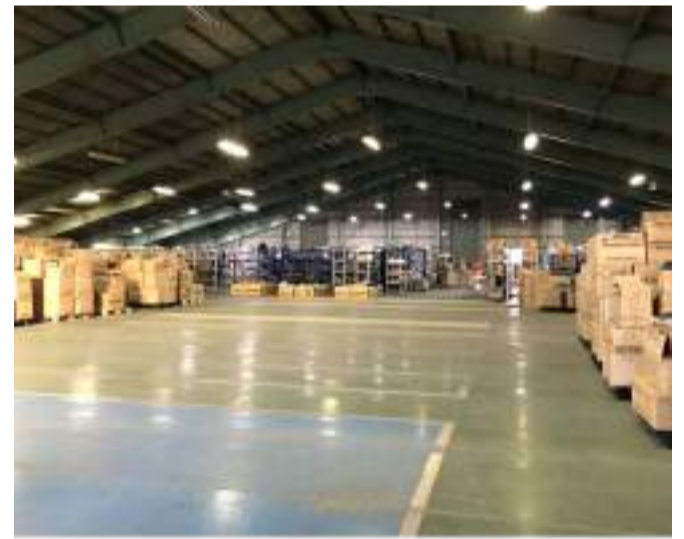
埼玉県川越市の倉庫では流通センターとしての機能もあり、御社のECサイトの発送業務もサポート。